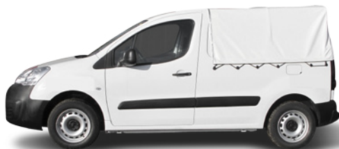
Version pick-up avec option bâche